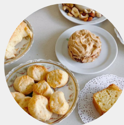
Coffe break de la tarde

Estas son las 4 comidas de una jornada laboral completa. Se pueden contratar las comidas que necesiten.